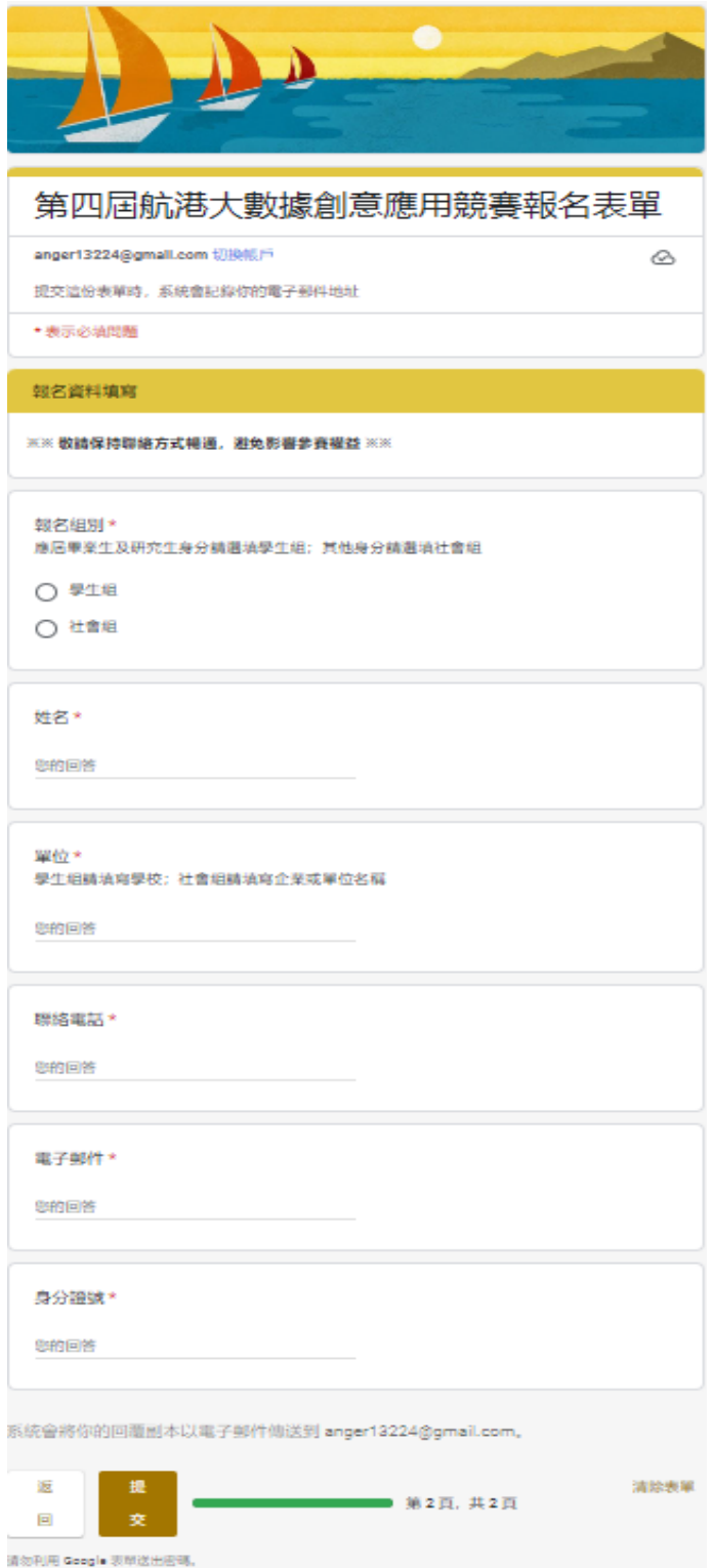
圖 1：報名表單提交頁面